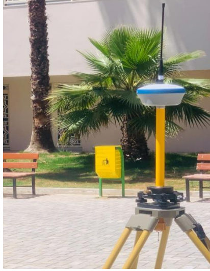
شكل 3: صورة توضح جهاز تحديد المواقع العالمي