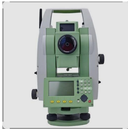
شكل 2: صورة توضح جهاز المحطة الشاملة

3.1.2 البناء والمشاريع الإنشائية: تسهم في تحديد مواقع الاساسات والهيكل الرئيسي للمباني .