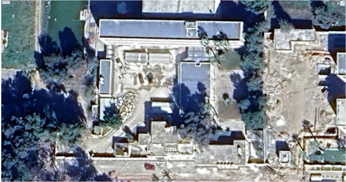
شكل 1 : صورة جوية لموقع الدراسة ( المعهد العالي للعلوم والتقنية البيضاء )